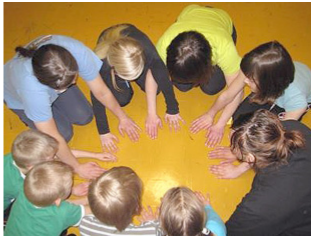
Kivirantalaisille lapsille järjestettiin kiipeilykerho