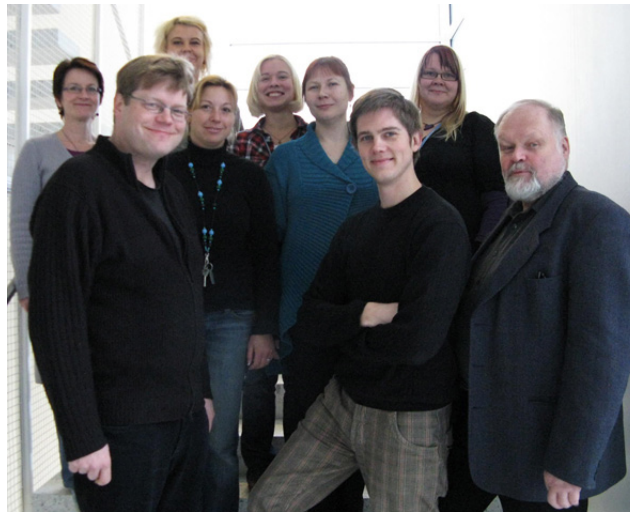
TKI-HUMAK Akselin väkeä

Jatkossa HUMAKin TKI-toiminnan tärkein näyte on olevan toiminnan kansainvälistyminen. Parhaillaan HUMAK on käynnistämässä useita kansainvälisiä hankkeita. Tulevaisuuden haasteisiin kuuluu vahvojen ulkomaisten TKI-partnereiden