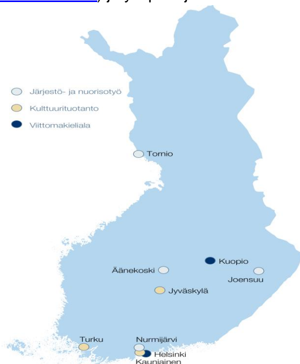
Kuva1: HUMAKin kampusten sijainti: opiskelijalla on mahdollisuus opiskella koko verkostossa ammattikorkeakoulun tarjoamia opintoja.