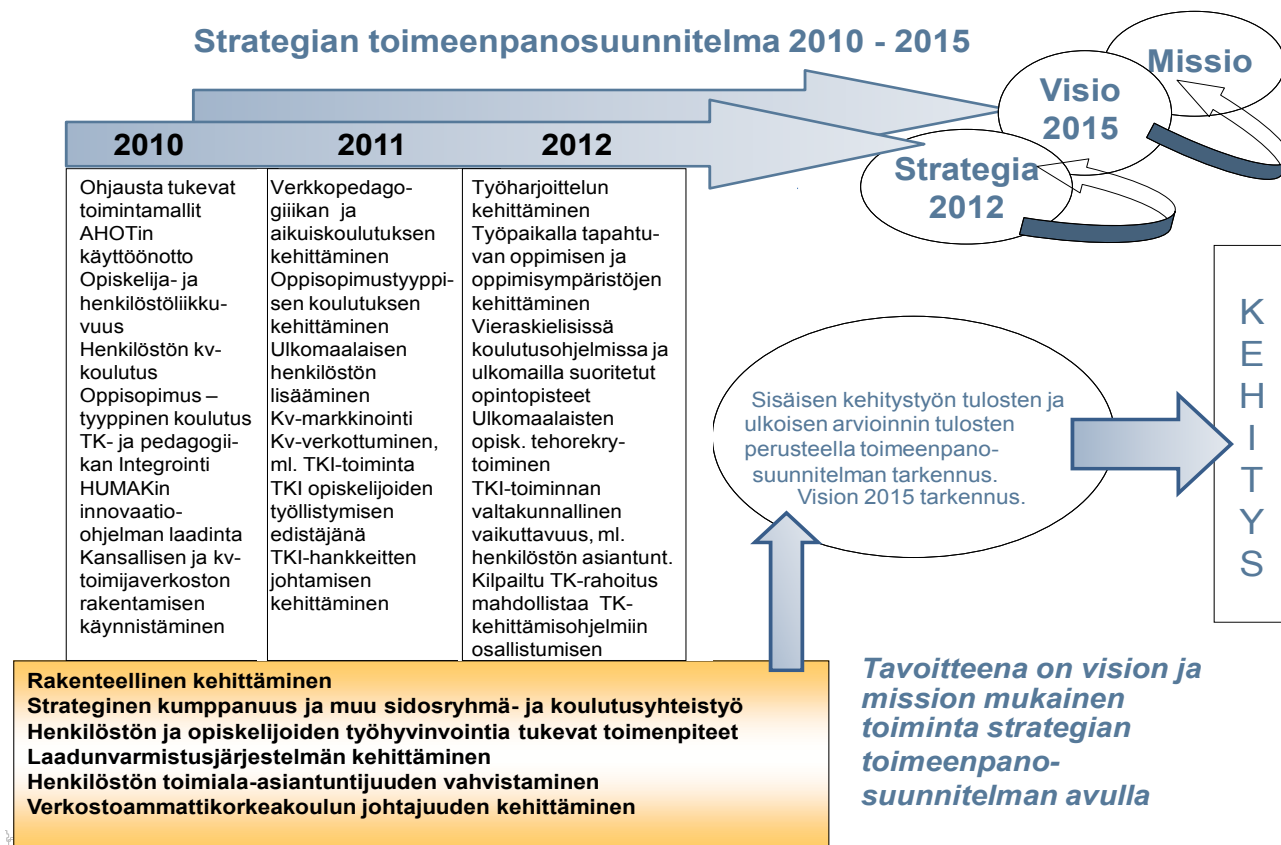
Kuvio 1. HUMAKin strategian toimeenpanosuunnitelma vuosille 2010 – 2012

Strategian toimeenpanosuunnitelma koottiin asiantuntijaryhmien työn pohjalta. Laadunvarmistusjärjestelmän kehittämistyö tuki tulosvuonna toimeenpanosuunnitelman laatimista, sillä laadulliset kysymykset ovat kytkeytyneet suoraan kuhunkin käsiteltävään teemaan. Ammattikorkeakoulun hallitus hyväksyi strategian toimeenpanosuunnitelman, jolla tavoitellaan HUMAKin vision, tehtävän, profiilin ja painoalojen toteuttamista tukevaa toimintamallia.