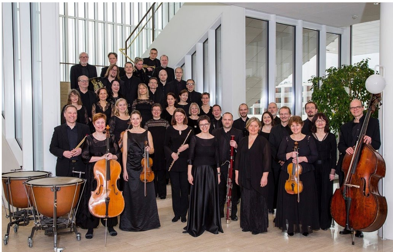
Tapiola Sinfoniettan musikit vuonna 2020.