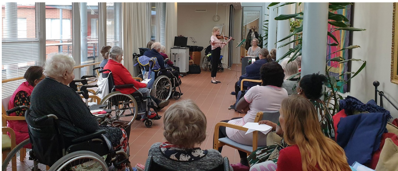
Itä-Helsingin musiikkiopiston järjestämä "Kulttuurihyvinvoinnin konsertti" Roihuvuoren seniorikeskuksessa.

keskustelua illan konsertin musiikilliseen antiin. Itse konsertin musiikki ja miljöö mukailevat alustuksen tematiikkaa. Esimerkkinä Festivaalin tematiikasta voi mainita vuoden 2009 teeman: "Auttakaa". Se toteutettiin yhteistyössä seitsemän hyväntekeväisyysjärjestön kanssa. Ennakkoluulottomuutta heijastaa myös Festivaalin esiintyjäkaarti, johon on Pekka Kuusiston lisäksi kuullut muitakin musiikin lajirajoja "rikkovia" muusikoita. Festivaalin myötä on herännyt kysymys niin esiintyjissä kuin kuulijoissa: Saako konsertti ja musiikki tuoda esiin ikäviä asioita?