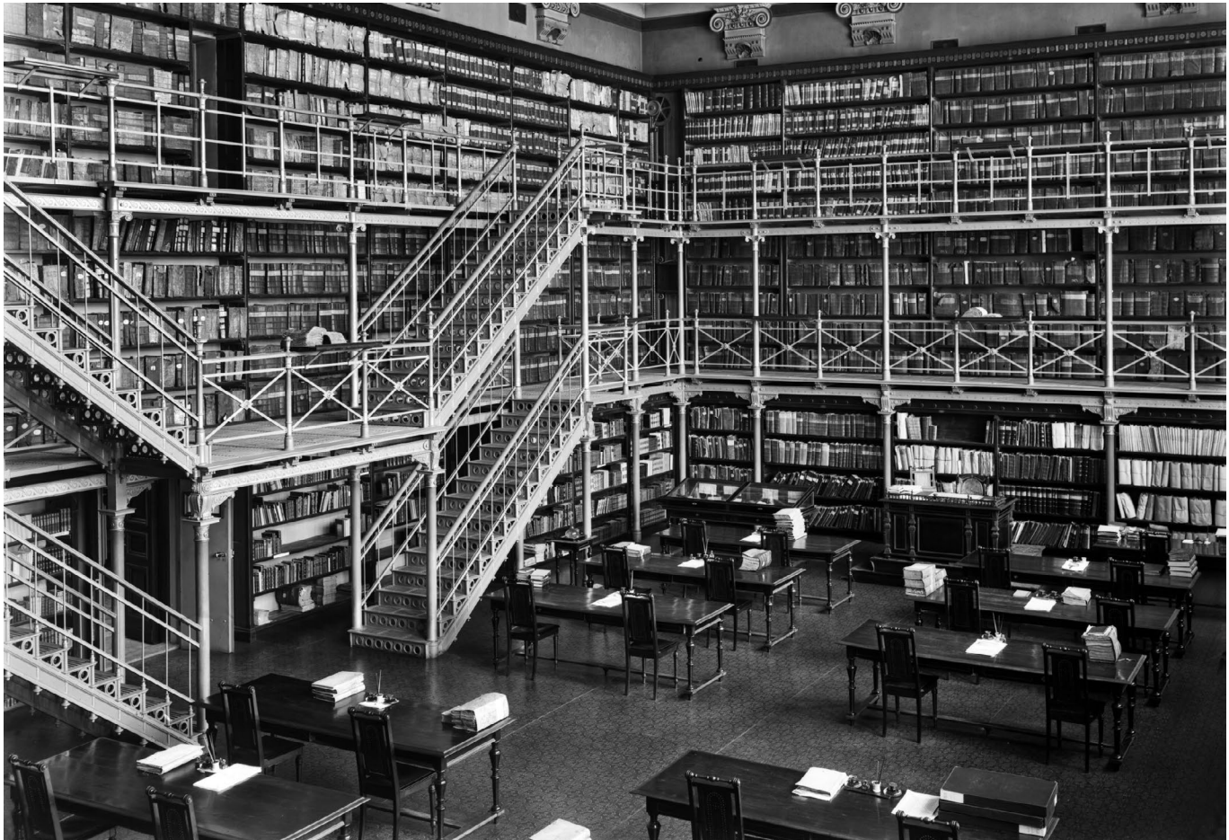
Valtionarkiston tutkijasali noin vuonna 1910.

kulttuuriin osallistumisen tavoista ja kulttuurilaitosten palveluista ovat muuttuneet internetin myötä. Yleisöjä koskevan tiedon käytön keräämisessä ja käytössä esiintyi kuitenkin hajontaa: 59 % vastaajista ilmoitti, että digitaalisten kanavien ja keinojen käyttö on tuottanut organisaatiolle uutta tietoa palvelua käyttävästä ja/tai käyttämättä jättävästä yleisöstä. Vastaajista 40 prosenttia taas kertoi, ettei palveluita käyttävästä yleisöstä kerry organisaatiolle tietoa.