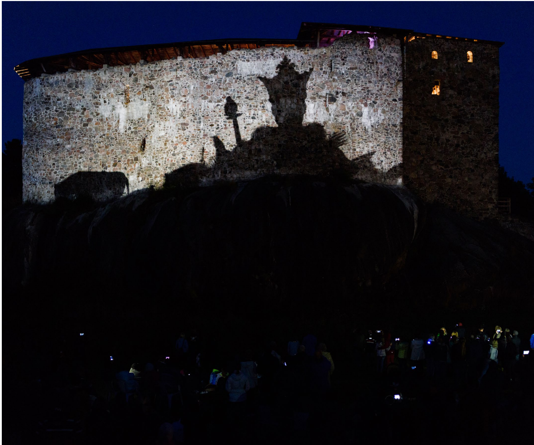
Kuva 4. Valotaideteos Reflection of History

Joulukuussa kokeiltiin Kuusistossa ja Raaseporissa vierailukauden laajentamista valon avulla myös joulunaikaan. Raunioiden hämärissä voi kulkea lyhdyn valossa ja kuulla kuorojen joululauluja, hiljentyä hartaushetkeen, nähdä tulitaidetta, tiernapojat tai Lucia-neidon kuoroineen, tavata historiallisia hahmoja ja tuoda oman koristeensa valaistuun joulukuuseen. Vuonna 2018 nähdään virolaisilla linnavuorilla Viro 100-hengessä heidän päätapahtumansa tämän vuoden tarinakävelyiden ja muiden pienimuotoisempien tempausten jatkoksi.