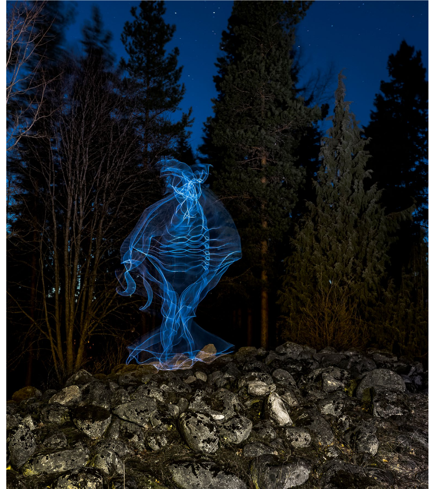
Video 1: Valotaideteos Reflection of History https://vimeo.com/238382387