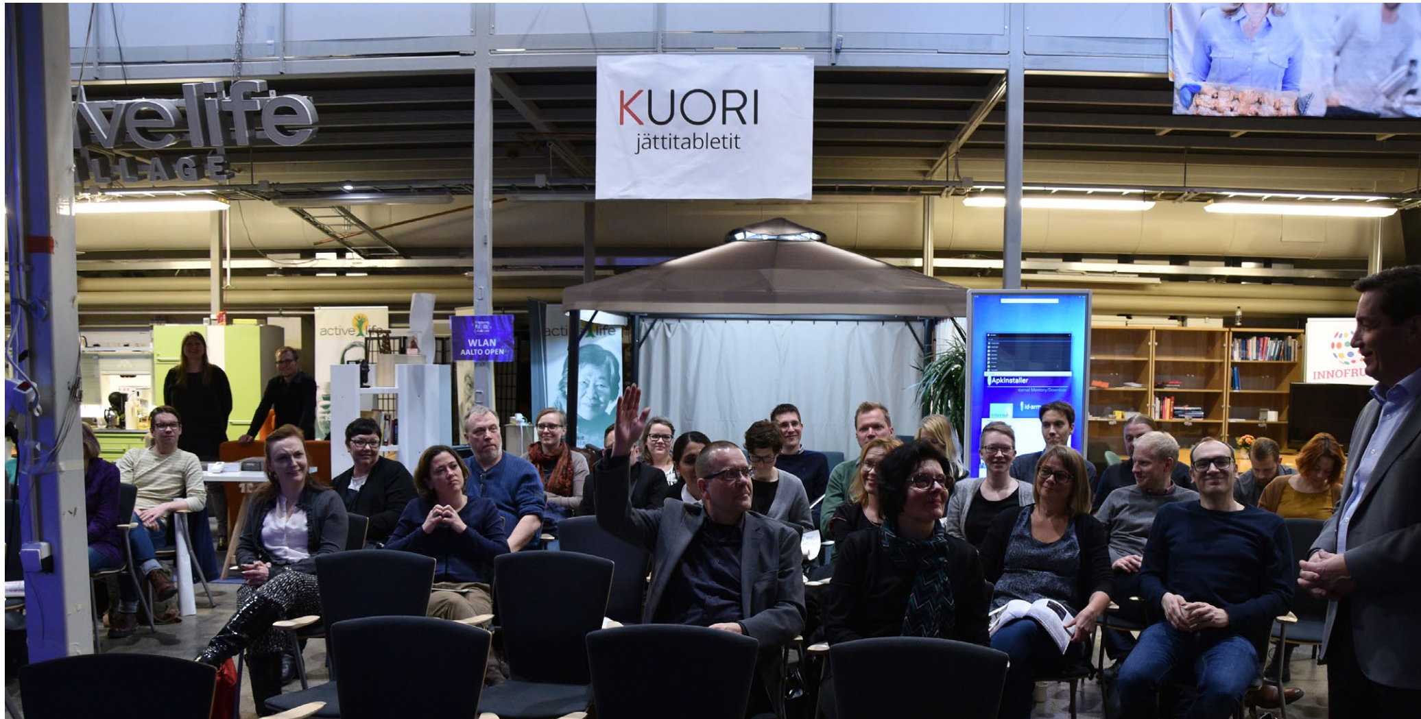
Humakin ja Aallon kulttuurituotannon muuttuvat toimintaympäristöt teemapäivä jatkoi yhteistyötä.

ta teknologiaa, tiedettä ja taidetta”. Näytelyssä tuotiin esille yhteistyötä Humakin kanssa esittelemällä yhteisiä avauksia ja tekemistä sekä yhteisiä hankkeita. Näyttelyn tarkoitus oli lisätä kaupunkilaisten tietoa 3D:stä, laserkeilauksesta ja fotogrammetriasta sekä niiden roolista ja vaikutuksesta yhteiskunnan ja kulttuurin kehitykseen.