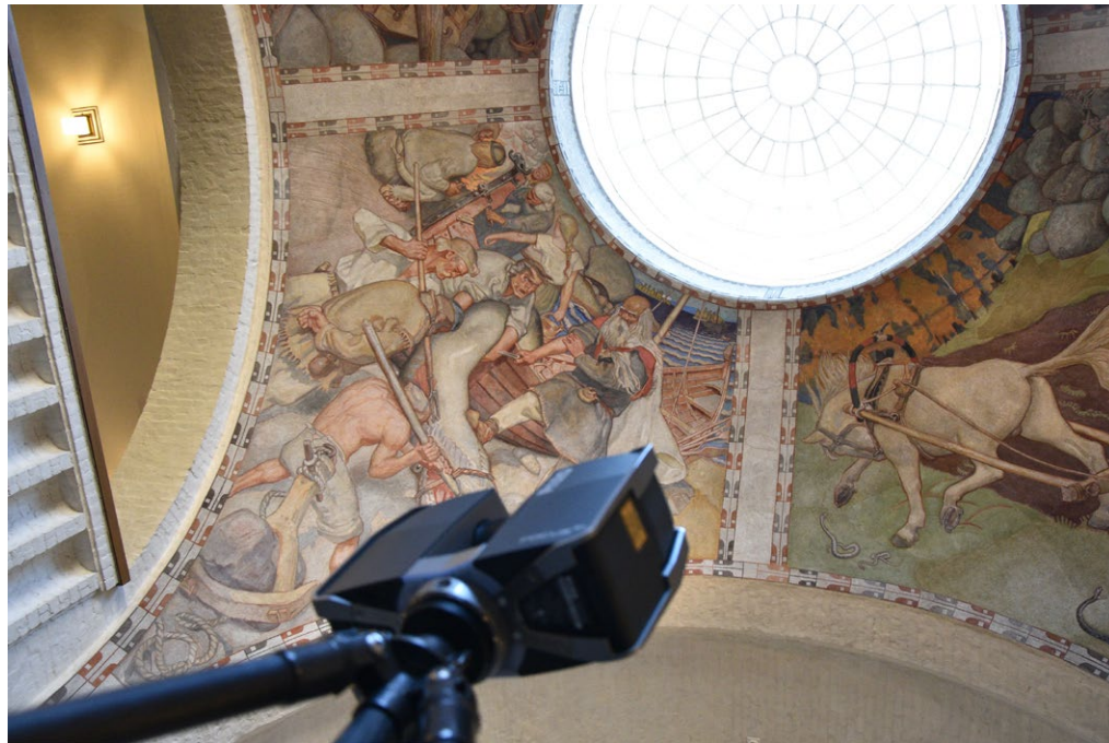
3D-kulttuurihubi toimii yhdistävänä kokeilualustana tuottaen lisäarvoa palveluiden kautta.